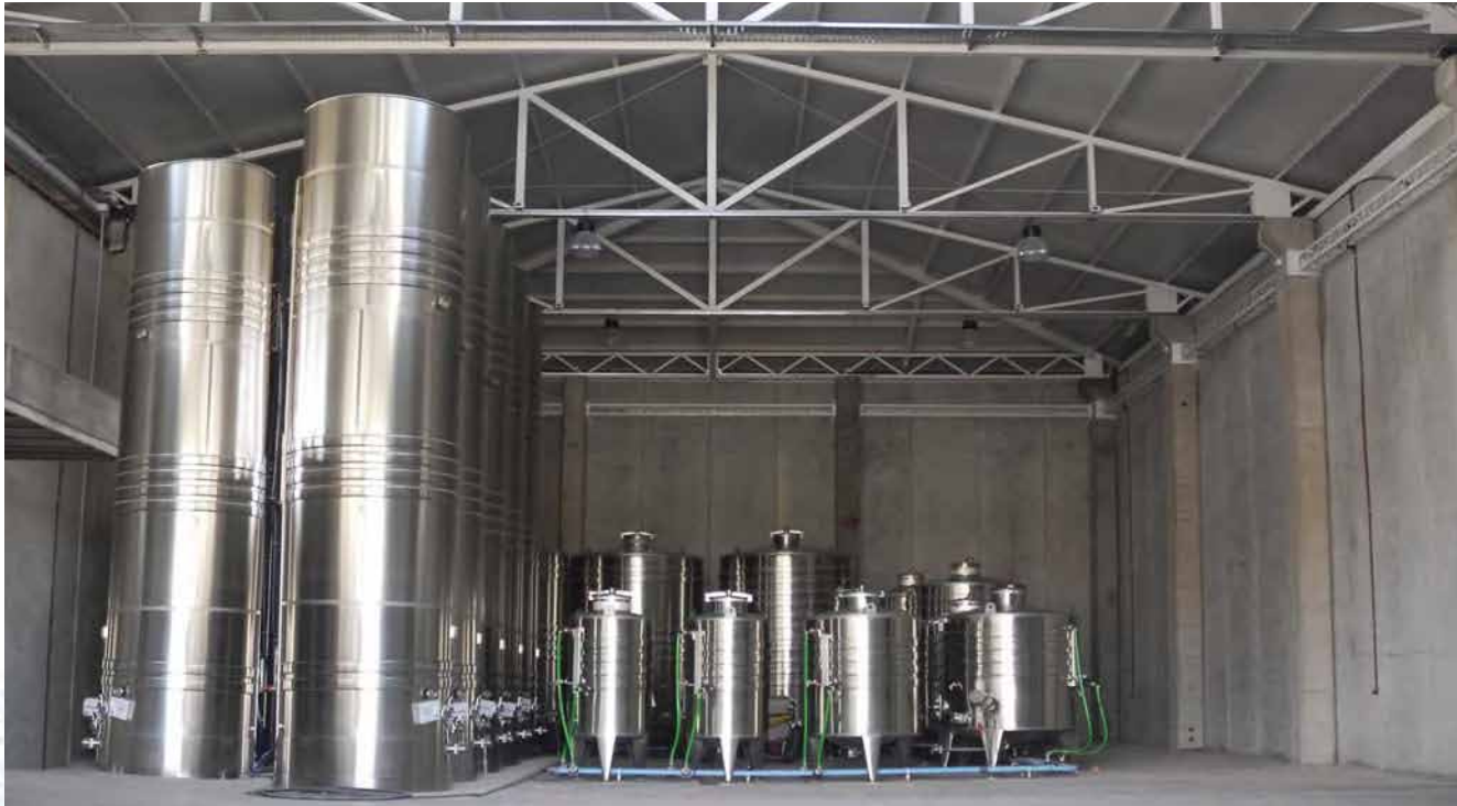
Cumple con la norma: NOM-008-ZOO-1994